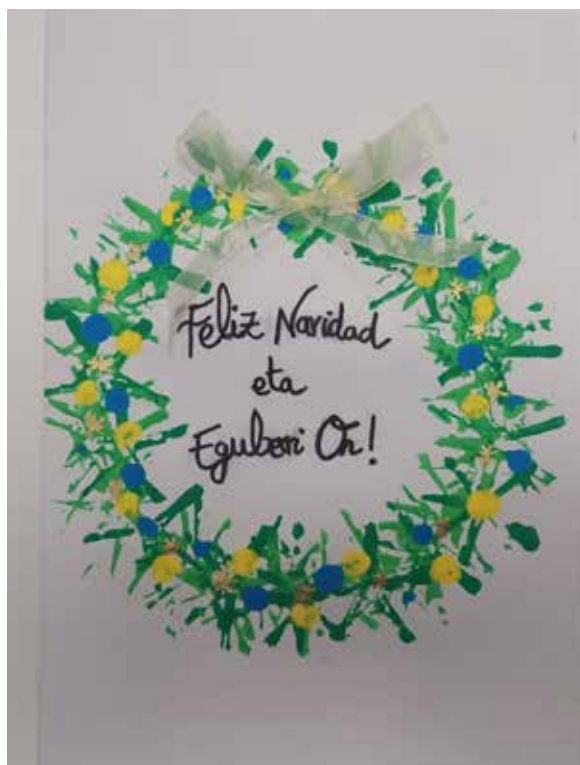
Postal ganadora del concurso de postales navideñas 2022. Autoría: grupo Kronos de ITACA SEPAP Ocupacional.